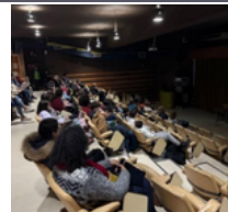
Escola Básica Augusto Moreno

Sensibilizar para o bem-estar e equilíbrio na vida escolar e pessoal.